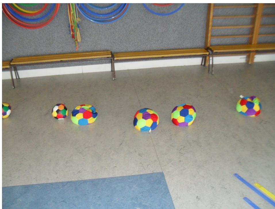
Les fruits à cueillir