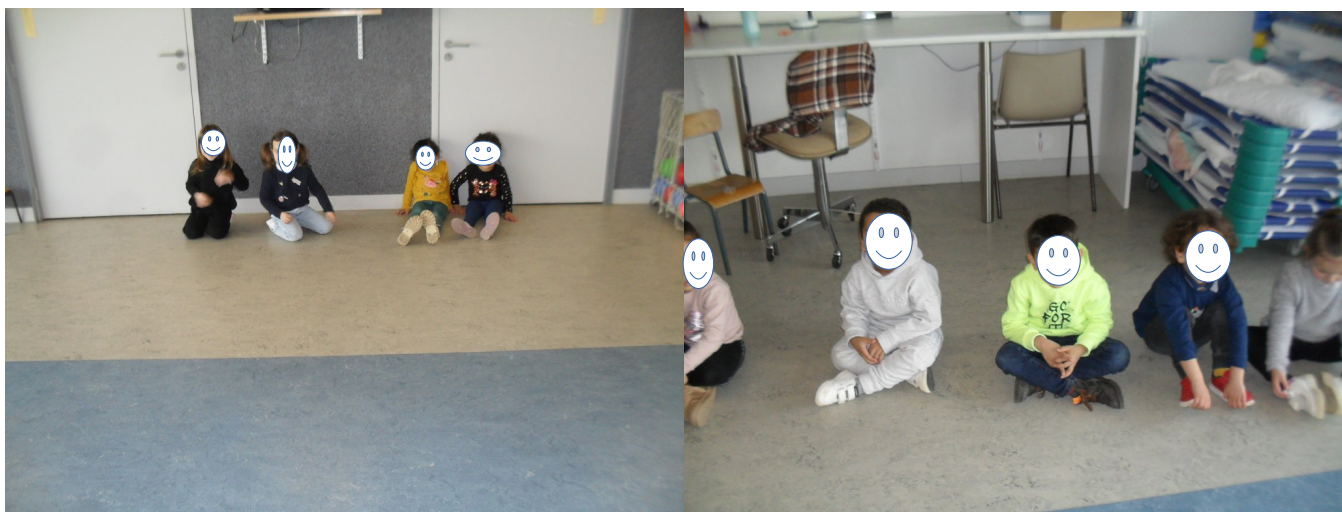
Les 2 équipes