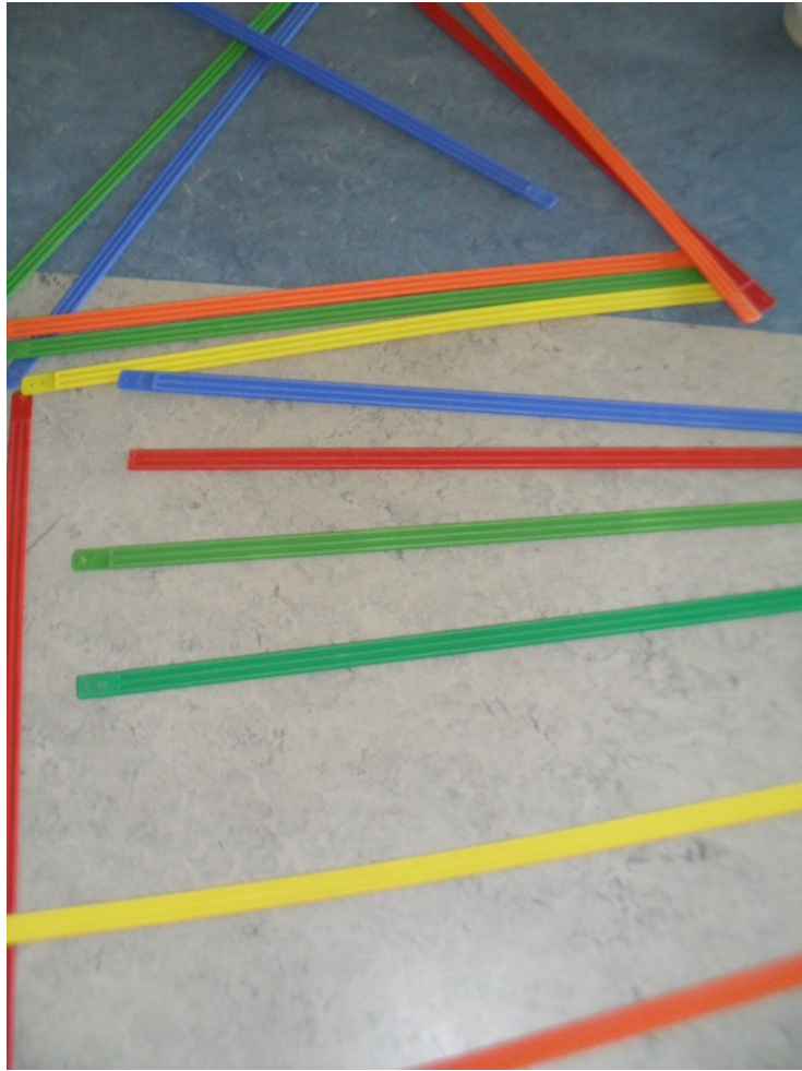
La construction de la maison est terminée