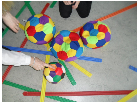
Les fruits cueillis et rapportés dans chaque maison sont comptés. On compare les collections et les maisons.